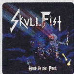
SKULL FIST HEAD OF THE PACK NoiseArt Records/Edel

Mit Jeff Healey hat die Blues Rock-Welt vor einiger Zeit einen ihrer ganz großen verloren, aber es gibt zum Glück noch ein paar weitere Künstler die diesen Style leben, lieben und spielen wie Eric Sardinas. Auf seiner neuen CD „Sticks And Stones“ grooved der Dobro- und Slide-Experte einfach unglaublich. Die Songs rocken, bluesen und haben auch noch Soul und Funk. Das klingt nach ZZ Top, Lynyrd Skynyrd, Richie Kotzen und ähnlichen Kalibern. Und natürlich klingt es nach Sardinas, seiner lässigen Stimme und seinem lässigen Slide-Spiel.