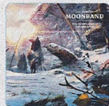
MOONBAND DENAVIGATION Rockville/Soulfood

Alein schon der Umlaut im Titel „Head Of The Pack“ macht deutlich, dass man hier feinsten 80er Jahre maßigen