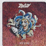
EDGUY AGE OF THE JOKER Nuclear Blast/Warner Music